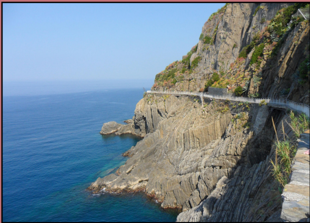
Esplorate Sentiero Azzurro