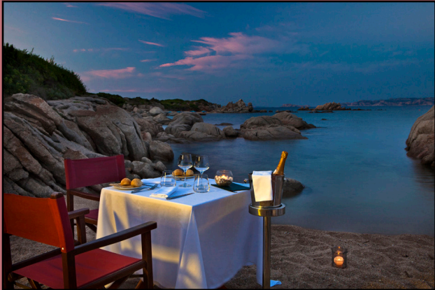
Romantiche Cene sulla Spiaggia