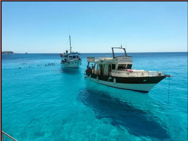
Relax sulla Barca Calpurnia